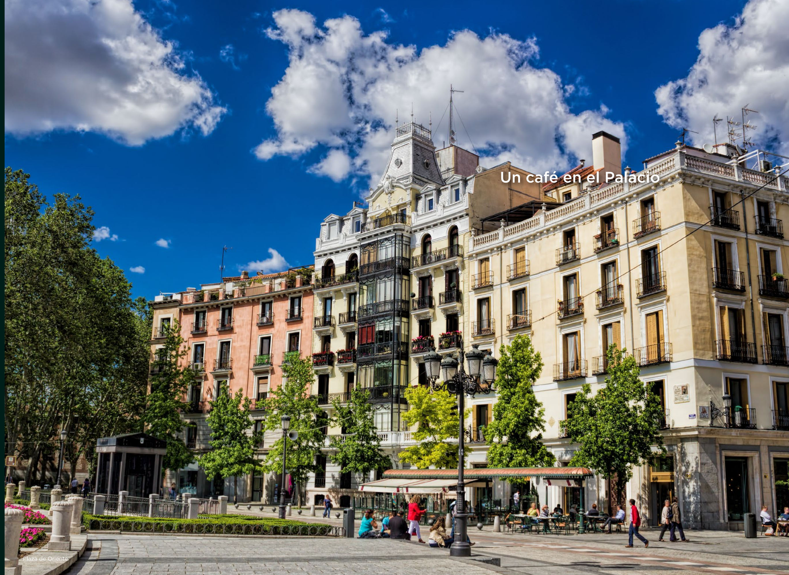
Plaza de Oriente