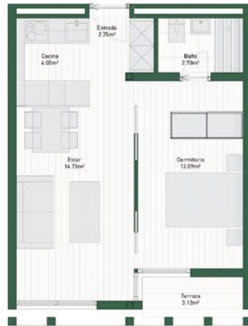
EJEMPLO DE VIVIENDA DE 1 DORMITORIO